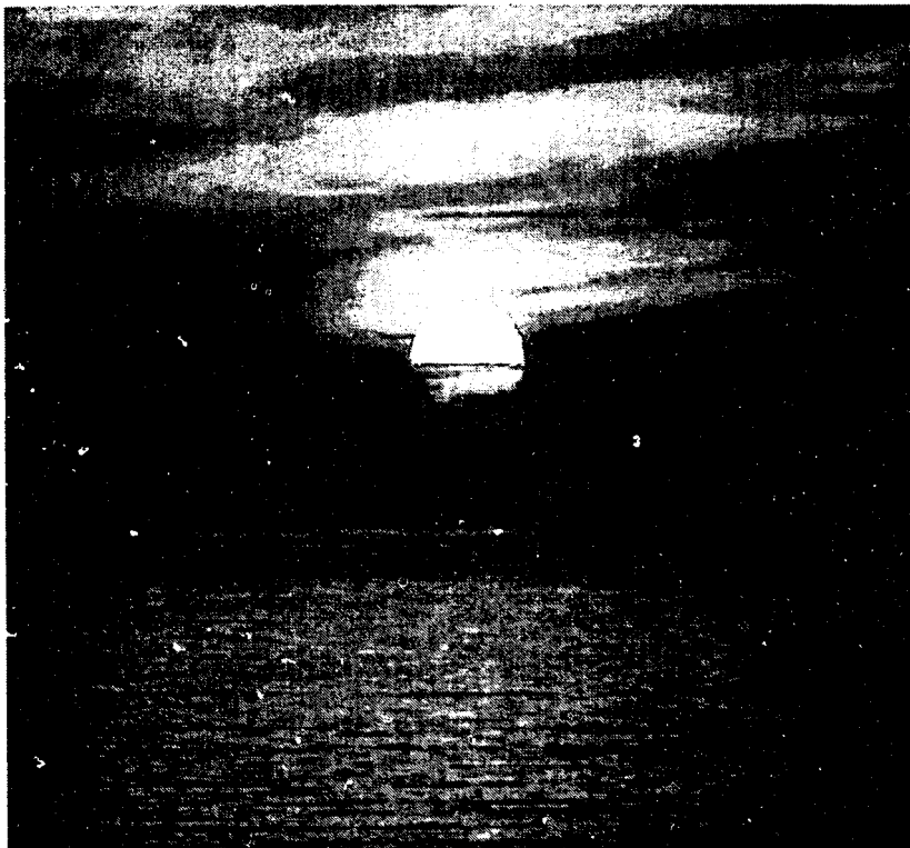
يوه ورځ به ورته وويل شي ! پورته شه نن له مغرب څخه طلوع وكړه