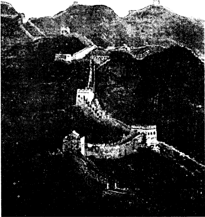
د چین دغه لوی دیوال په انساني تاریخ کې داوردو تعمیرونو یوه نادره نمونه ده