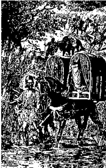
زن ایرانی به زیارت کربلا می‌رود

هفتم: آن بارگاه‌ها که در مشهد و قم و عبدالعظیم و بغداد و سامره و کربلا و نجف و دیگر شهرهاست و شیعیان به زیارت روند خود جداگانه داستانیست.