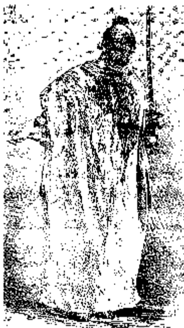
یک تن از قمه زنان

آغازیده چنین گفتند: «پس فرنگی‌ها امام حسین را می‌شناسند و شما نمی‌شناسید، ای بی‌دین‌ها؟!». این را گفته به تکان آمدند.