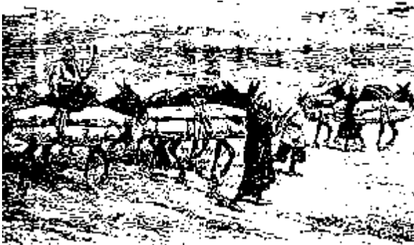
استخوان‌های مردگان را بار کرده به کربلا می‌برند

این کار را چرا می‌کنند؟!... به آن استخوان‌ها چه کاری هست که از این شهر به آن شهر می‌کشند؟!... اگر از خودشان بپرسید یکی خواهد گفت: یک در بهشت از کربلا یا از نجف یا از قم است، و مرده‌ای که در آنجا خوابیده همان که بوق دمیده شود و برخیزد یکسره به بهشت خواهد رفت. دیگری خواهد گفت: مرده‌ای را که در قوطی گزارده‌اند و به نجف یا به کربلا خواهد رفت از فشار گور ایمن باشد. دیگری خواهد گفت: ما گناهکاریم و به آن آستان پناهنده می‌شویم. یا خواهد گفت: ما سگیم و خود را به نمکزار می‌اندازیم.