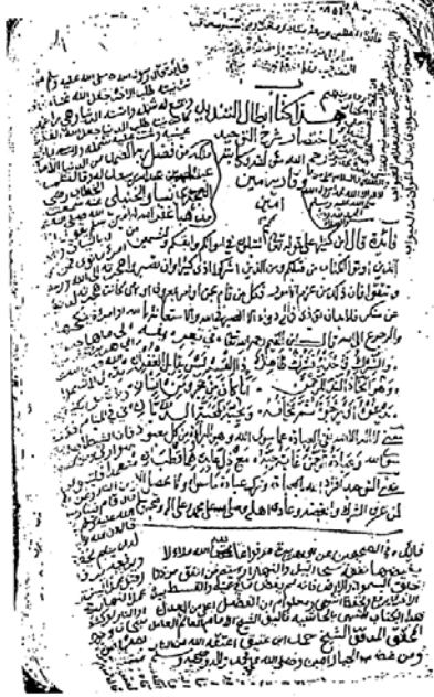
الصفحة الأولى من إبطال التندید